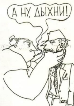
Рисунок Вагима Мисюка

— Все дело в том, что профилактика без лечения, без реабилитации действительно малоэффективна, поэтому предусматривается создание на базе наркологических диспансеров медико-реабилитационных центров. Там люди смогут трудиться, зарабатывать деньги, приобретать специальность. Сейчас многие предприятия попросту избавляются от алкоголиков. Если раньше отсюда они направлялись в АТП, то теперь там этим никто не занимается. Один директор мне прямо